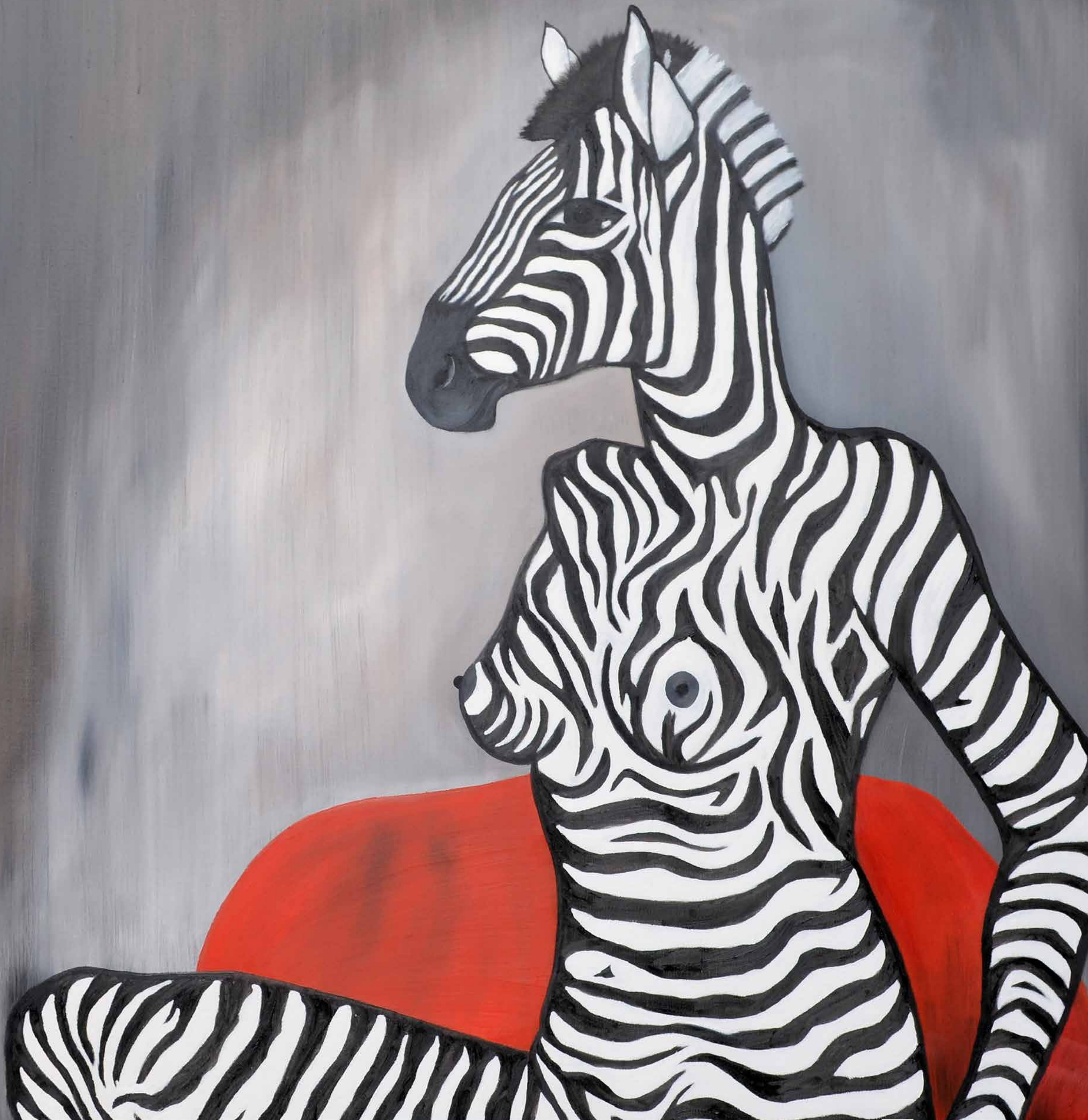
ZEBRA. WAS SONST?, 2014, Öl auf Leinwand, 100 x 90 cm | Dieses Bild kann gemietet oder gekauft werden