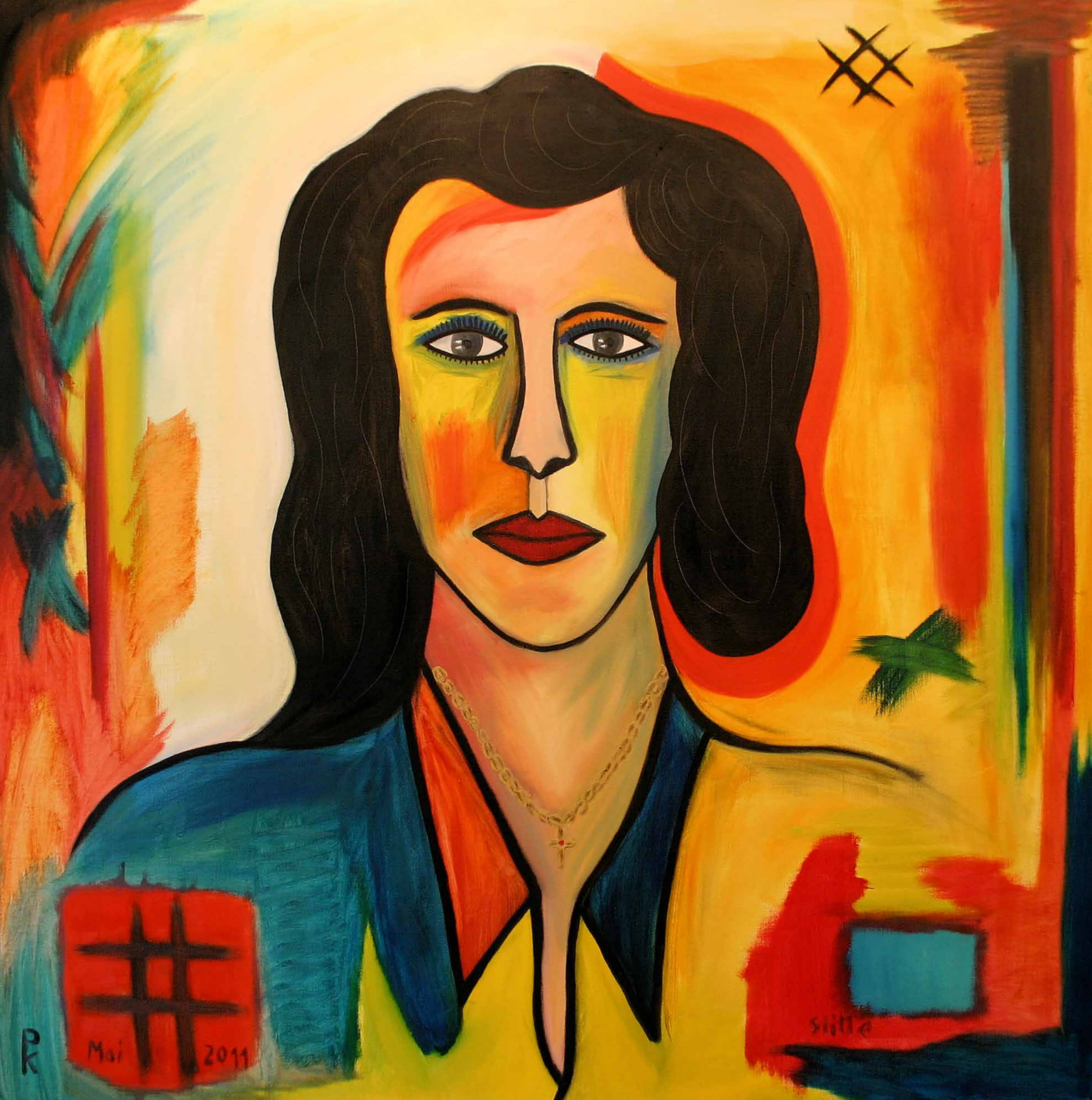
STILLE, 2011, Öl auf Leinwand, 120 x 110 cm | Dieses Bild kann gemietet oder gekauft werden