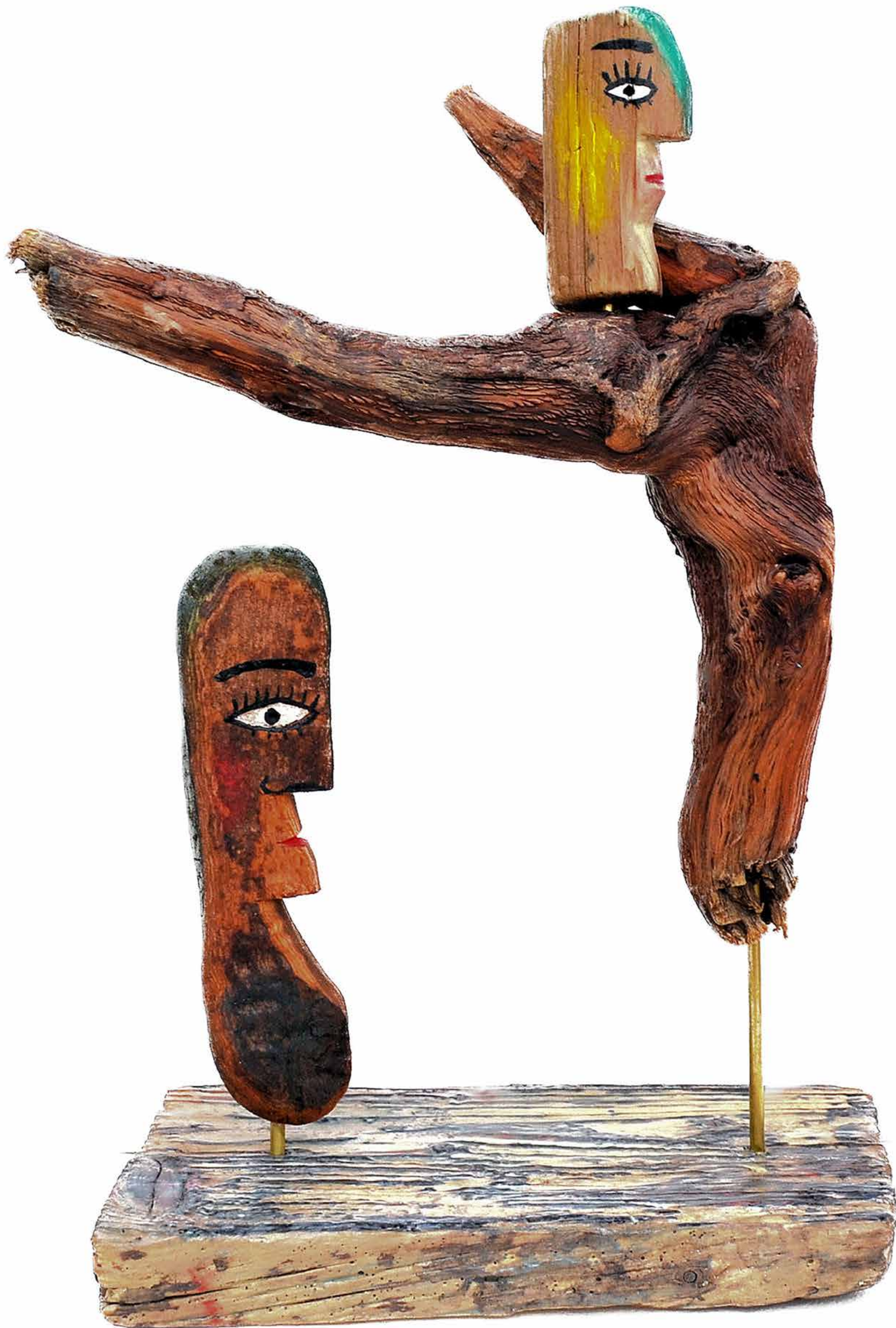
DIE SCHUTZHEILIGE, 2013, Skulptur, 32,5 cm hoch | Diese Skulptur kann gemietet oder gekauft werden