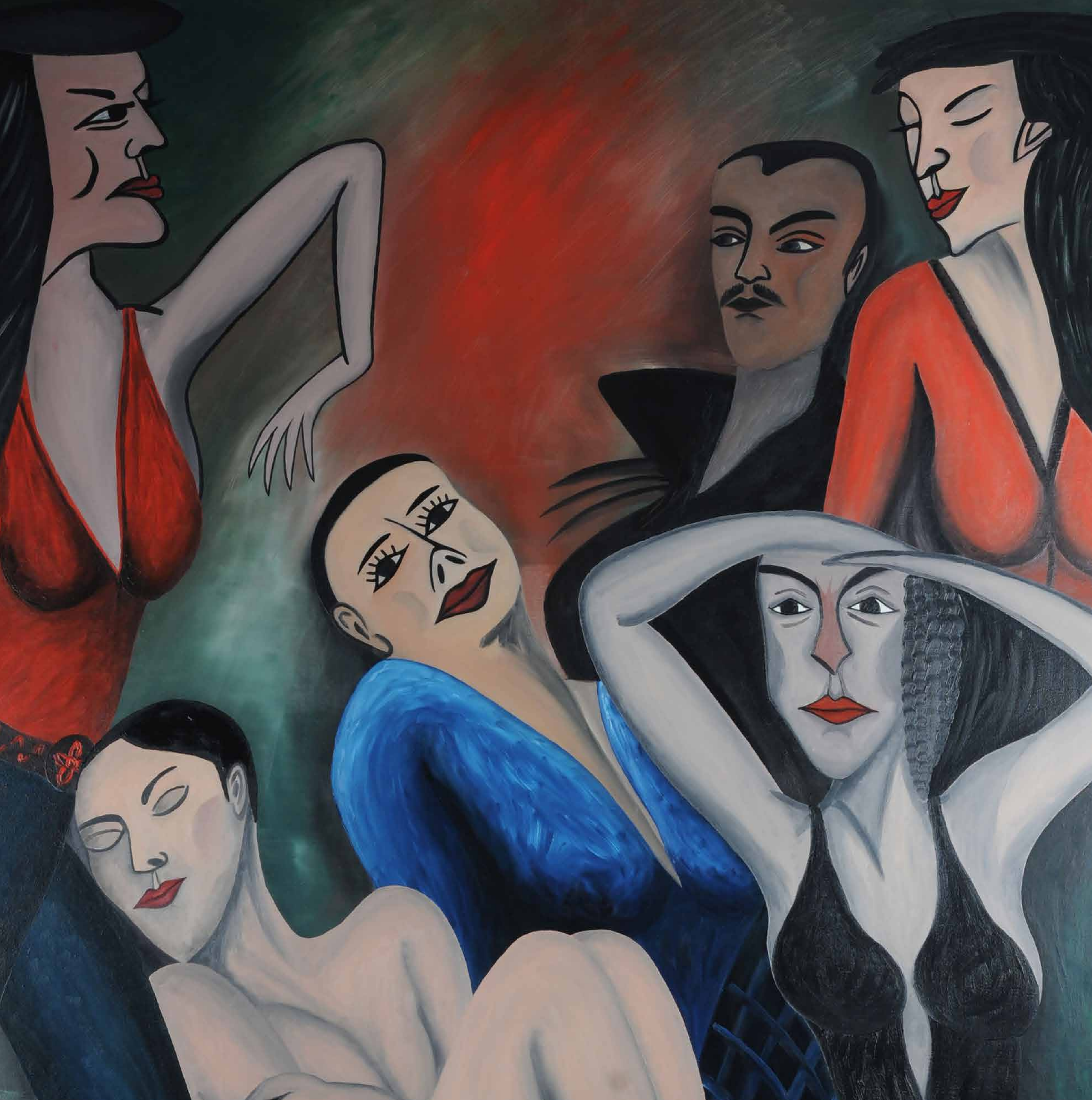
GRUPPENBILD MIT MANN, 1988, Öl auf Leinwand, 140 x 115 cm | Dieses Bild kann gemietet oder gekauft werden