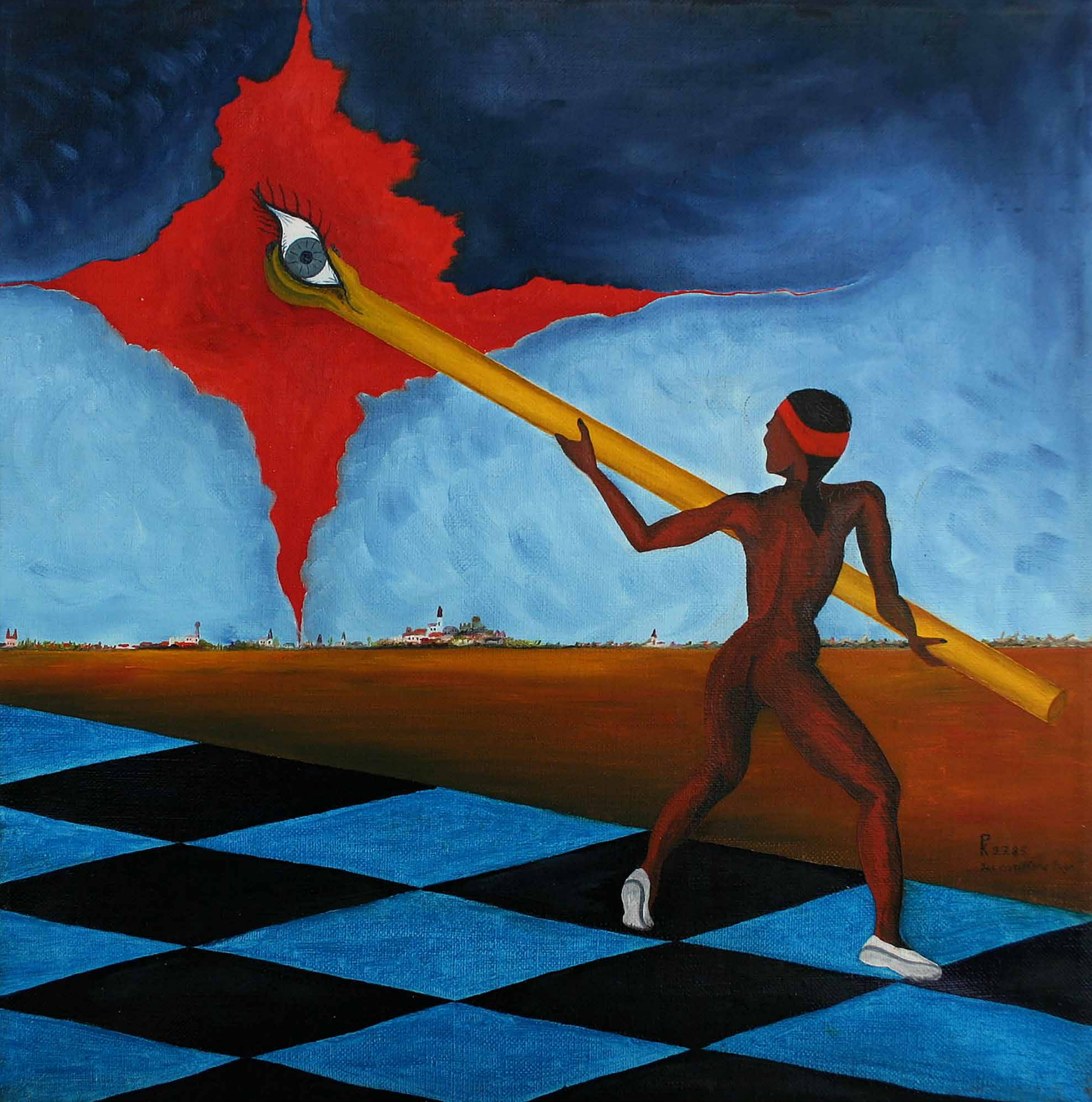
DAS ERGRIFFENE AUGE, 1985, Öl auf Leinwand, 39 x 39 cm | Dieses Bild kann gemietet oder gekauft werden