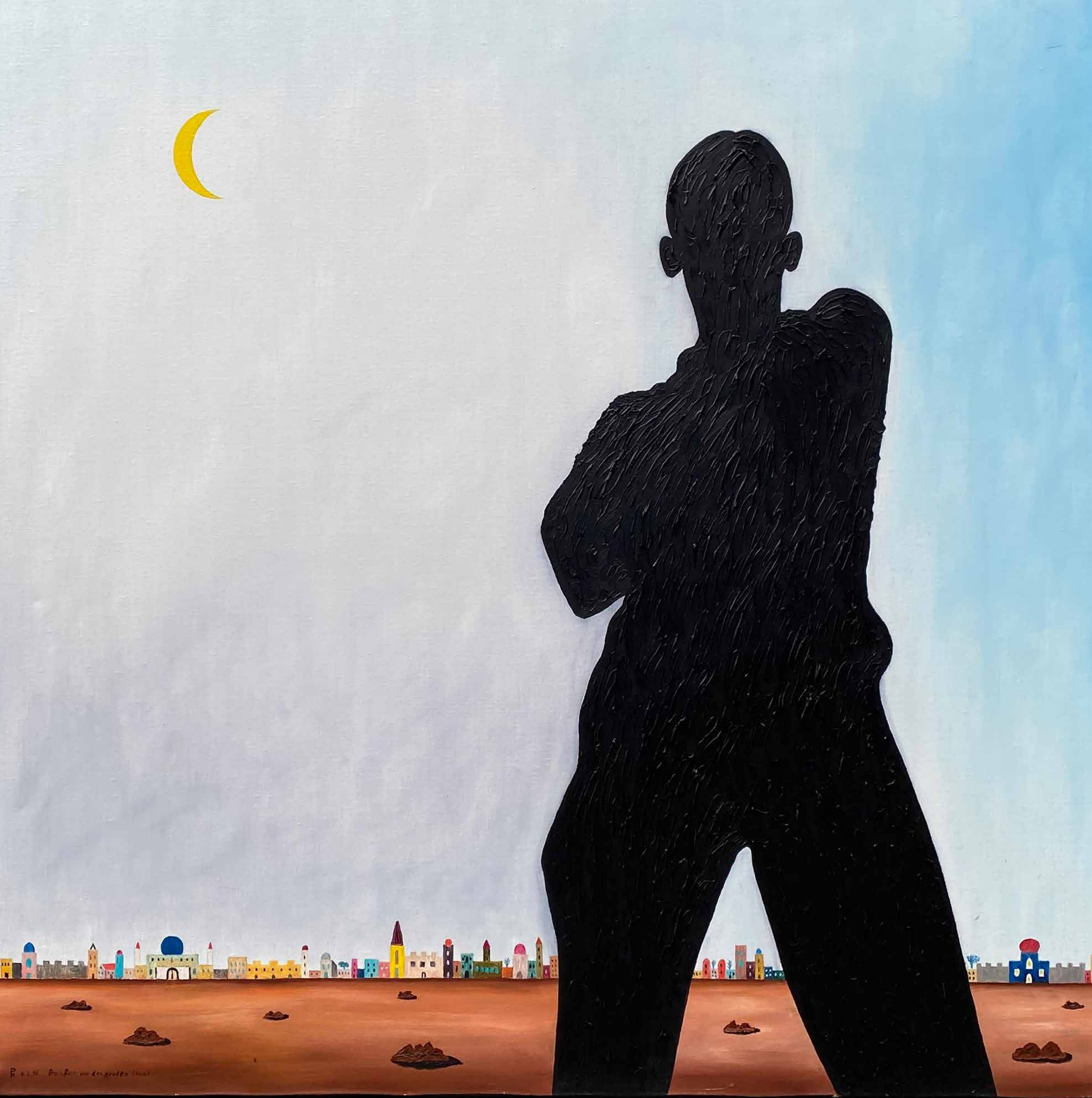
DRAUßEN VOR DER GROßEN STADT, 2010, Öl auf Leinwand, 100 x 100 cm | Dieses Bild kann gemietet oder gekauft werden