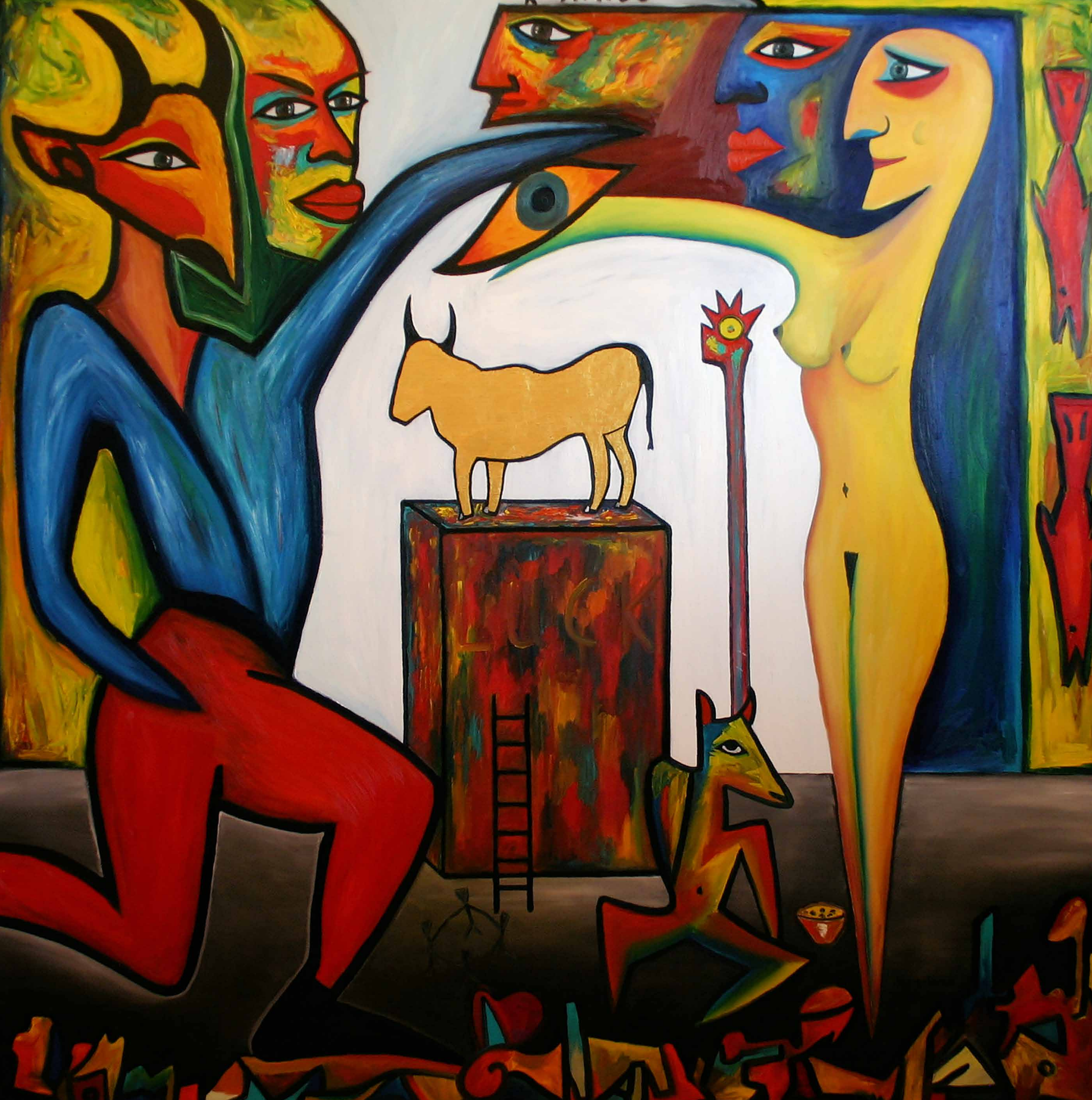
DAS GOLDENE KALB, 2000, Öl auf Leinwand, 160 x 160 cm | Dieses Bild kann gemietet oder gekauft werden