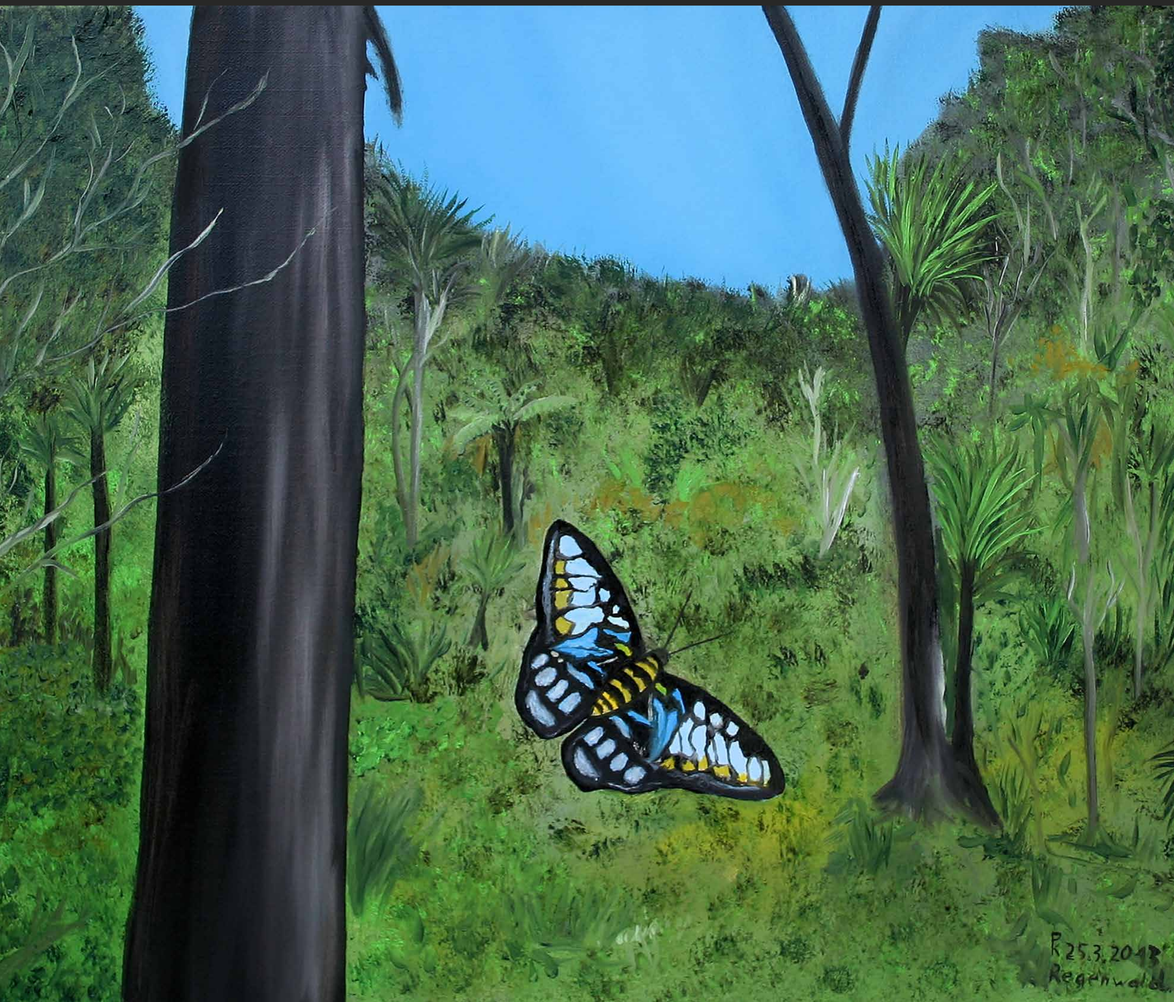
REGENWALD, 2013, Öl auf Leinwand, 50 x 60 cm | Dieses Bild kann gemietet oder gekauft werden