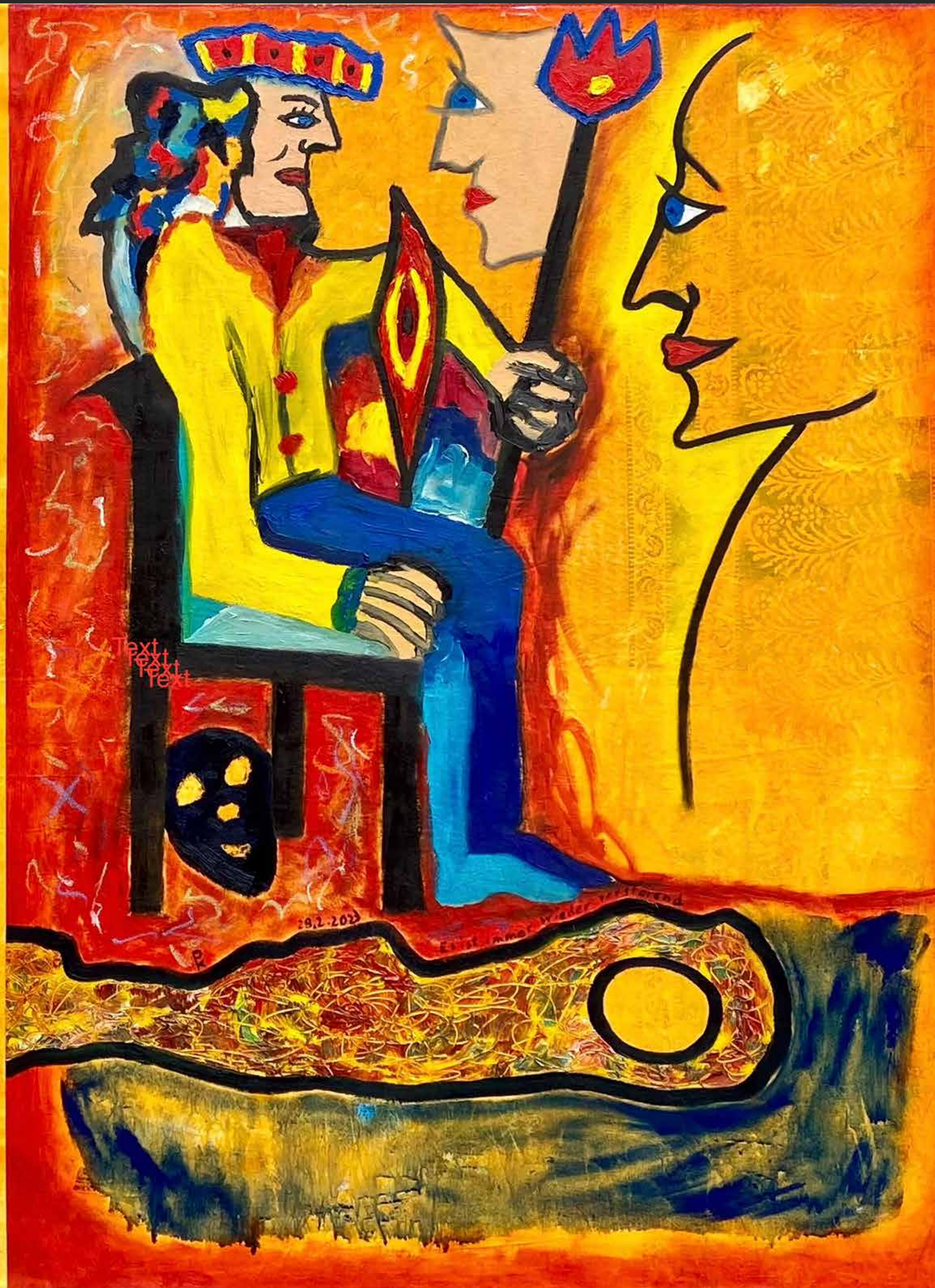
ES IST IMMER WIEDER VERSTÖRENDE, 2023, Öl auf grundierter Tischdecke, 110 x 140 cm | Dieses Bild kann gemietet oder gekauft werden