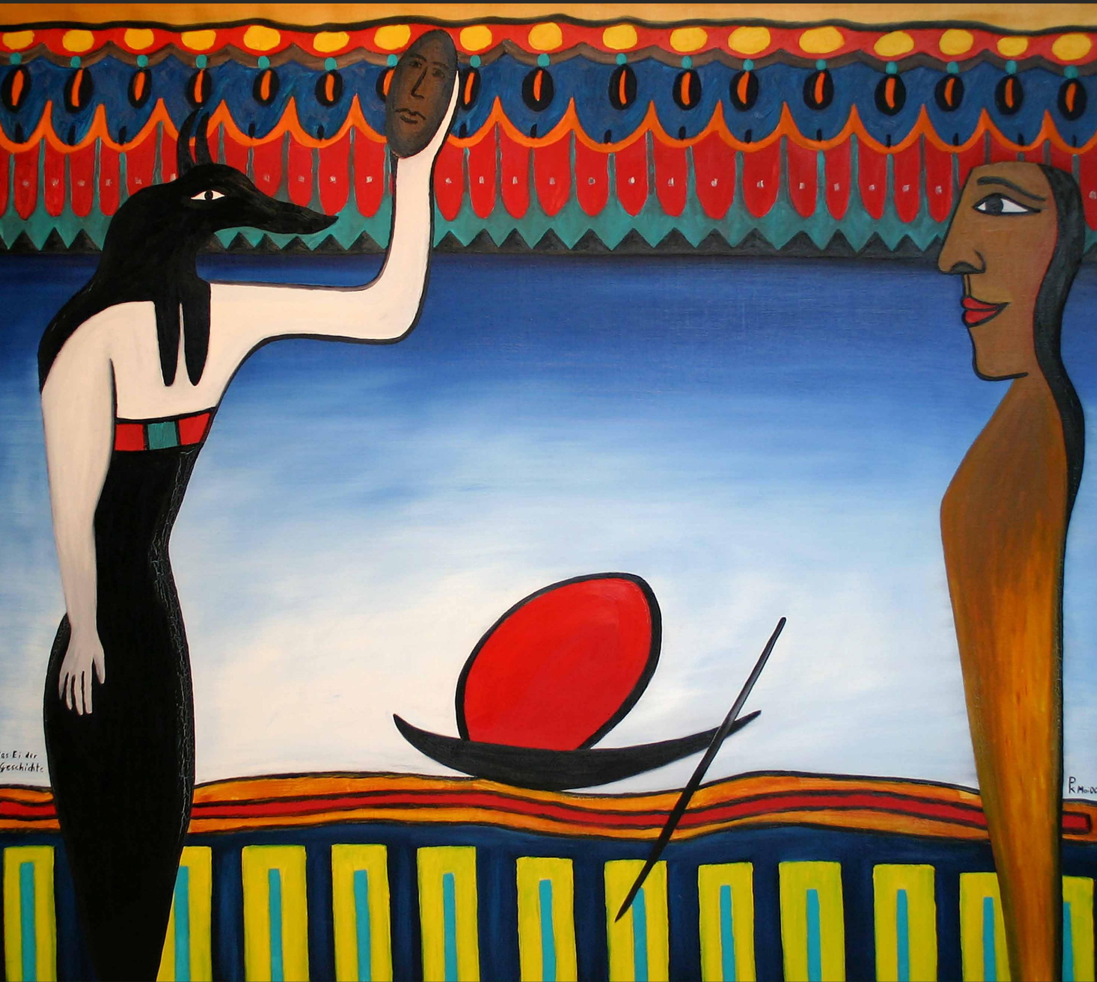
DAS EI DER GESCHICHTE, 2000, Öl auf Leinwand, 110 x 130 cm | Dieses Bild kann gemietet oder gekauft werden